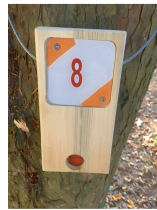
Balise à trouver sur le terrain

Carte réalisée en 2017 f.simonneau@wanadoo.fr 0677174396